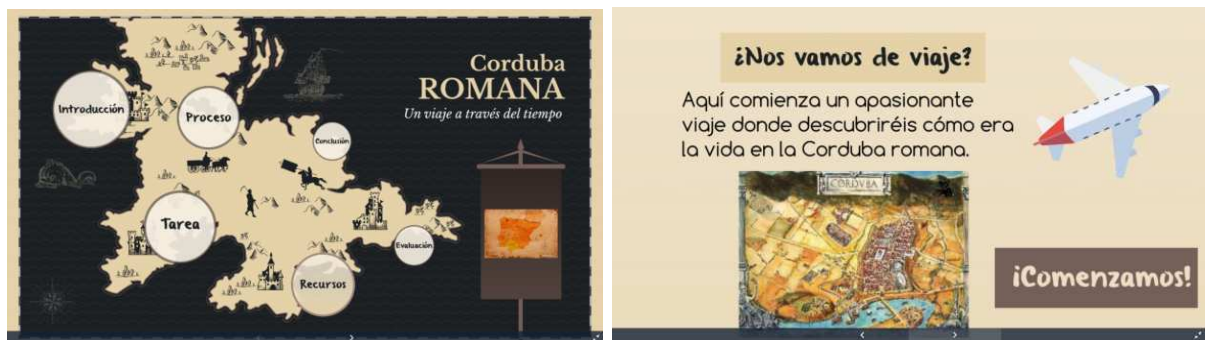
Figuras 7-8. Prezi sobre Corduba romana: https://prezi.com/view/OJQjdDQuufFRGJI10zR0y/

En nuestra primera parada, los pequeños grupos elaboraron un guiñol y una maqueta del puerto cordubense. La investigación dio paso a una salida por el entorno del río Guadalquivir y una visita a la zona donde se estableció el puerto de Corduba , para que conozcan su situación estratégica y las relaciones comerciales que tuvo con otras provincias del Imperio romano. Para documentar previamente a los/as alumnos/as, le presentamos un texto que narra la importancia que tuvo esta colonia por sus exportaciones de vino, aceite, trigo, plomo y plata, y para que también puedan conocer el sistema monetario de los romanos. Posteriormente, iniciamos un breve debate para que se fijen en la ubicación del templo de la calle Claudio Marcelo de Córdoba, puedan reflexionar porqué este edificio se destinó al culto imperial y diferencien las partes que componen su distribución interna y externa. Para la elaboración de este espacio sacro investigaron a través de diversos enlaces web y descubrieron cómo se decoraba, a qué dioses se veneraban y qué símbolos religiosos aparecían en su interior. La elaboración de un puzzle hizo que a través de esta investigación los/as estudiantes llegaran a conclusiones de manera grupal, con el fin de canalizar sus respuestas y plasmarlas en el blog de aula en el que recogieron los edificios en los que se daba culto.