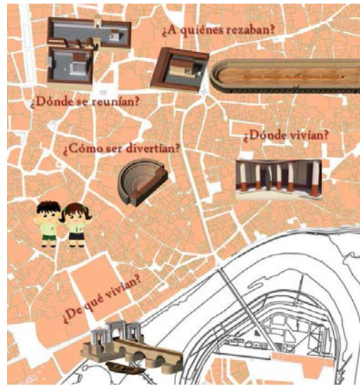
Figura 1. Temáticas trabajadas en los talleres didácticos.

Para elaborar este recurso planificamos un itinerario didáctico en Google Maps y también sobre un callejero actual de nuestra ciudad. A partir de este recurso, que no fue una simple visita guiada sino diseñada y elaborada por los/as estudiantes, pudimos trabajar las seis temáticas citadas y asimismo exponer lo que habían preparado en las paradas correspondientes. Divididos en pequeños equipos de investigación (4-5 alumnos/as), cada uno de ellos se encargó de recoger toda la información sobre las diferentes paradas que realizaron y que explicarán a sus compañeros como expertos en las materias trabajadas.