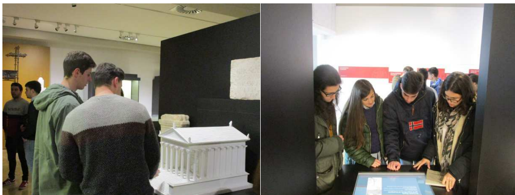
Figuras 13-14. Visita al Museo Arqueológico de Córdoba.

En cuanto a la visita al Museo Arqueológico de Córdoba, aquí los diferentes grupos trabajaron las mismas temáticas que en la salida para complementar los conocimientos que habían adquirido con las investigaciones previas. Estas investigaciones y la toma de contacto con la cultura material del museo sirvieron para confeccionar un cuaderno didáctico con actividades adaptadas a los/as discentes de segundo y tercer ciclo de Educación Primaria. Las actividades que tuvieron varias fases se elaboraron de manera previa a la visita al museo, durante toda la visita y en una sesión final para mostrar cómo se vivía en tiempos de los romanos.