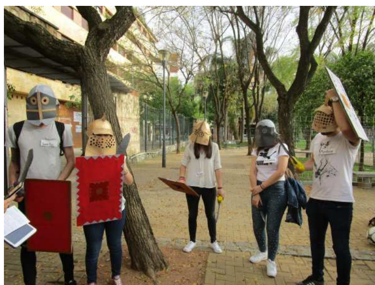
Figuras 9-12. Alumnos/as caracterizados/as exponiendo en las distintas paradas del itinerario.